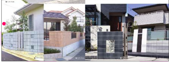
プレミアム積み材webカタログ