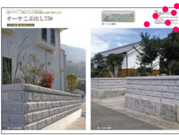
オーヤシリーズ webカタログ