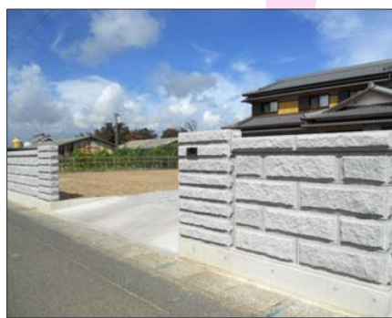
2012 入選 愛知県豊橋市 豊橋機材 株式会社 様