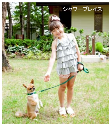
ライフスタイル部門

URL http://www.nikko-ex.com/ebooktp.html