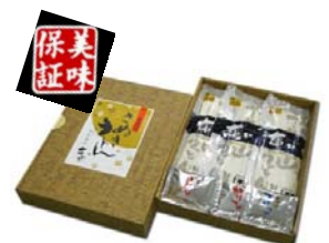
亀城庵の讃岐うどん(9人前)

・2013年12月2日(月)に弊社ホームページ内で発表させていただきます。 ○応募用紙等、詳細はホームページ内にて掲載しておりますので、ご覧ください。 URL http://www.nihon-kogyo.co.jp/2013photocon01_01.html