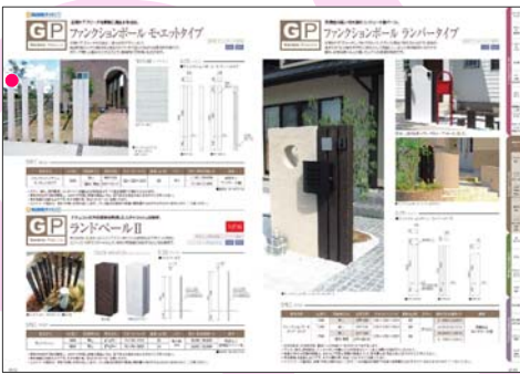
ガーデンコンシェルジュブック webカタログ