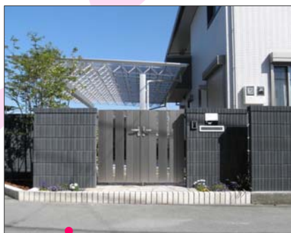
2012 入選 山梨県甲府市 有限会社 エクステリア中川様