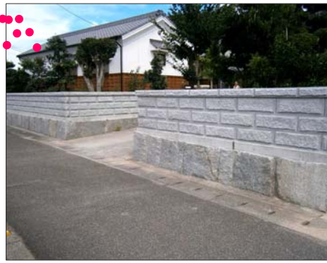
2012 入選 愛媛県今治市 マルマストリング 株式会社 様