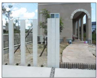
2012 入選 愛知県豊橋市 カネヒコ様