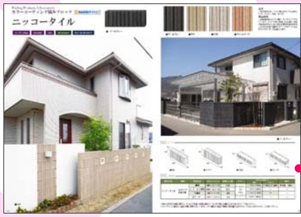
プレミアム積み材webカタログ