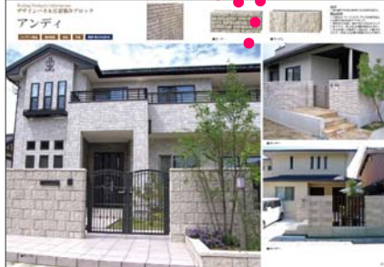
プレミアム積み材webカタログ

カラーコーティング積みブロック 耐候性・成形ブロックに比べ色落ち・劣化の心配が少なく、 美しい外観を実現してゆくお家へのアクセントを兼ねます。