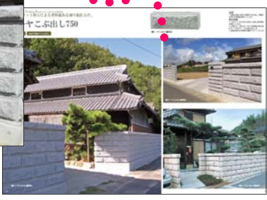
オーヤシリーズ webカタログ